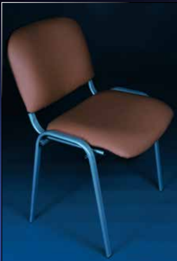
stacionární židle pro pacienta s opěradlem Code Nr. Z 04 01