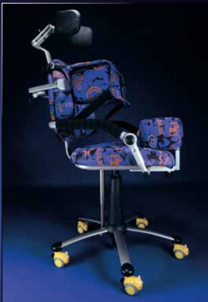
Speciální židle pro postižené děti