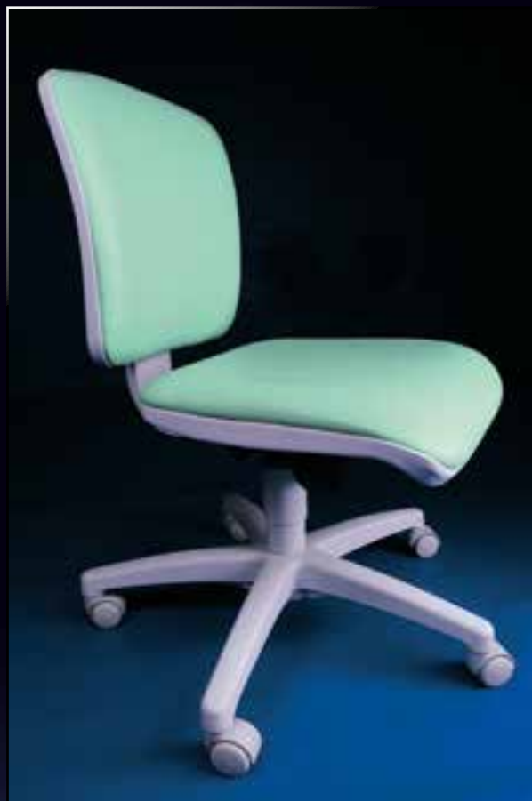
židle s opěradlem s šedými plasty Code Nr. Z 02 02