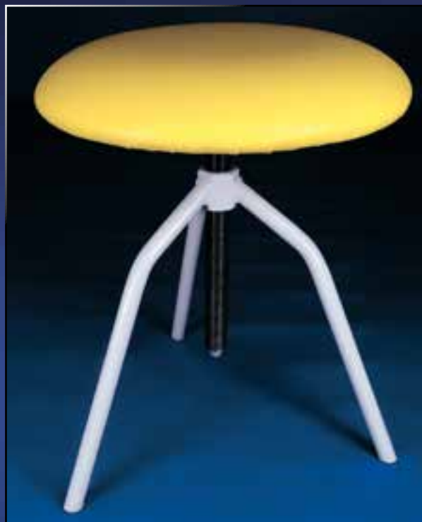
bobek na šroubu Code Nr. Z 03 01