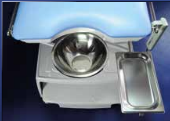
Nerezový táč na nástroje

Výška nastavitelná elektropohonem 640 – 940 mm, nastavení sklonu opěradla elektropohonem 0° až +80°, manuální nastavení sklonu hlavy ± 30°, nastavení sklonu sedáku (Trendelenburg) elektropohonem 0° až +20°. Stůl je vybaven elektronikou, která umožňuje naprogramovat 3 pracovní polohy, které se automaticky nastaví po stisknutí tlačítka. Velmi jednoduše tak lze měnit nástupní a pracovní polohu stolu bez časové prodlevy.