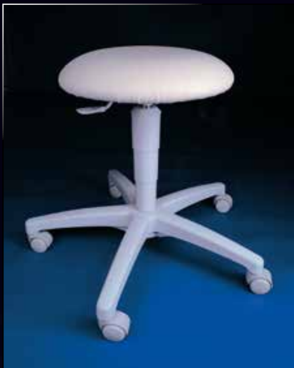
bobek s šedými plasty Code Nr. Z 02 01