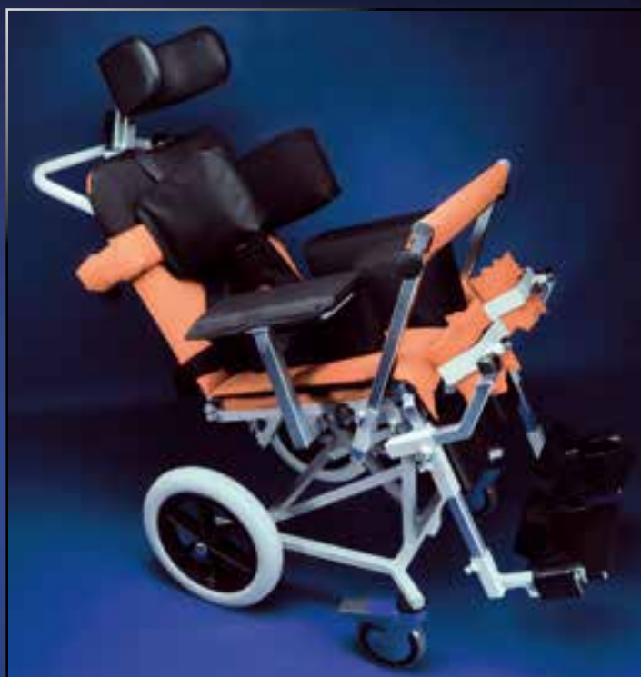
Polohovací zařízení pro postižené PINGUINO