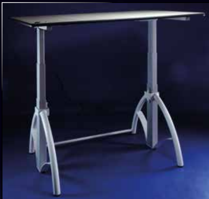
Pracovní plocha pro postižené s elektrickým nastavením výšky