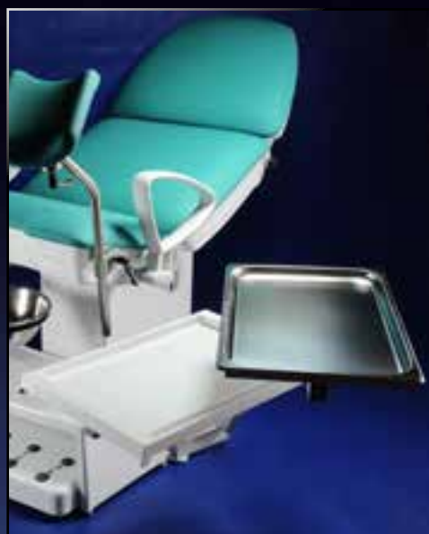
Dvojitý ták (vlevo/vpravo)