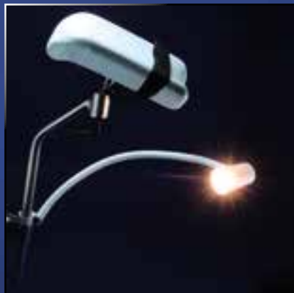
Code Nr. D 06 10