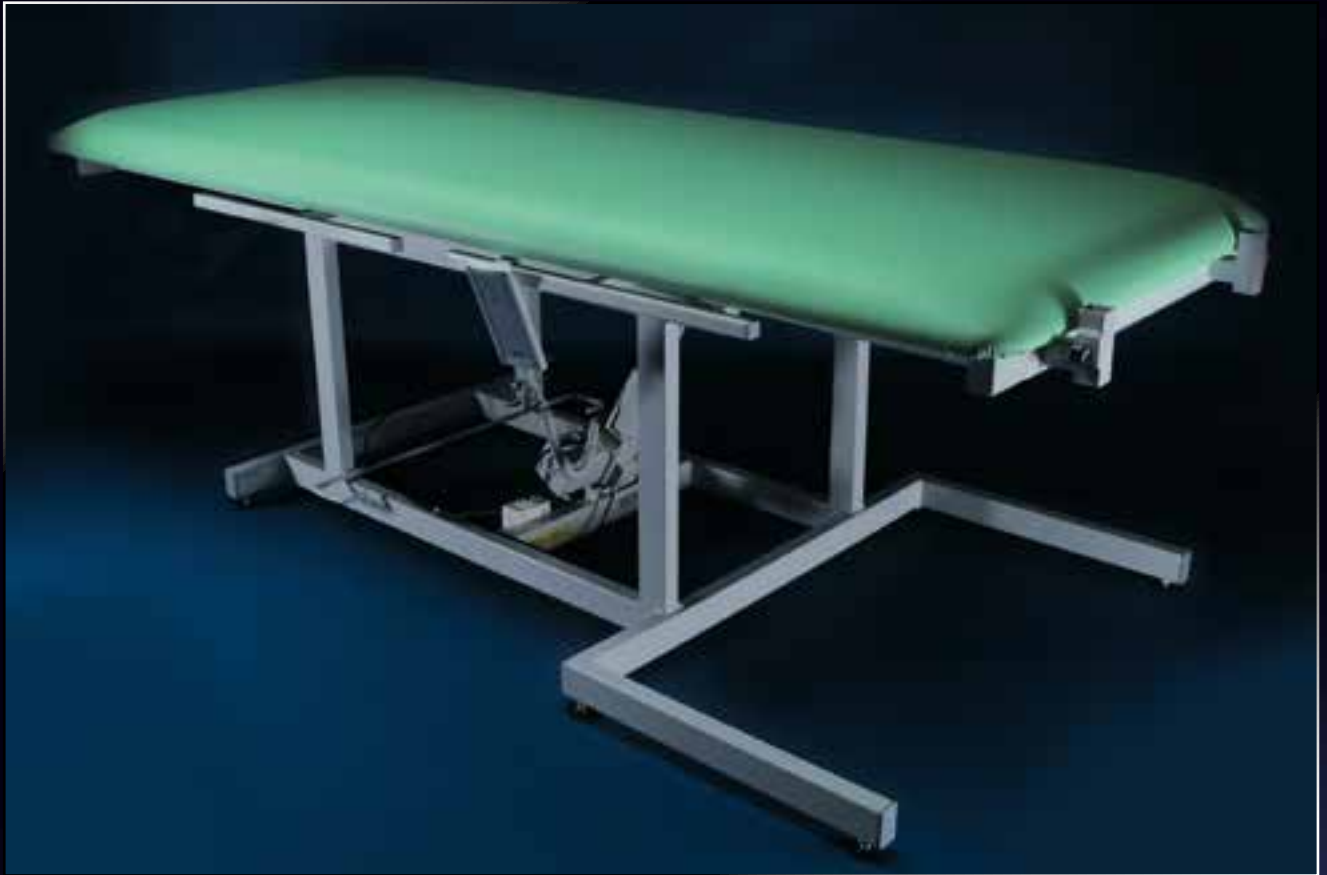
GOLEM VP pevná výška 650 mm